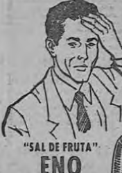
"SAL DE FRUTA" ENO

Si se siente usted deprimido, tome un vaso de la efervescente Sal de Fruta ENO... en caso de seguridad, se sentirá usted mejor!