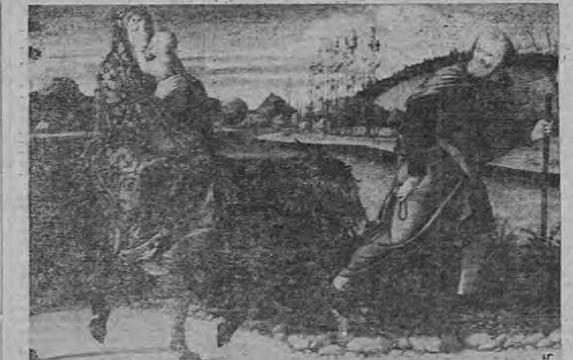
LA HUIDA A EGIPTO — De Giovanni Bellini, Galería Nacional de Arte de Washington.

—Una día de domingo le informé que había sucedido una tragedia. Esperaba aquella ansiedad escuchar las aventuras de un rey o un rico mercader o cosa por el estilo, no las de